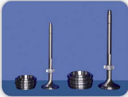
L/S60MC,L/S50MC 排气阀, 阀座 L/S60MC,L/S50MC exh. valve spindle,seat