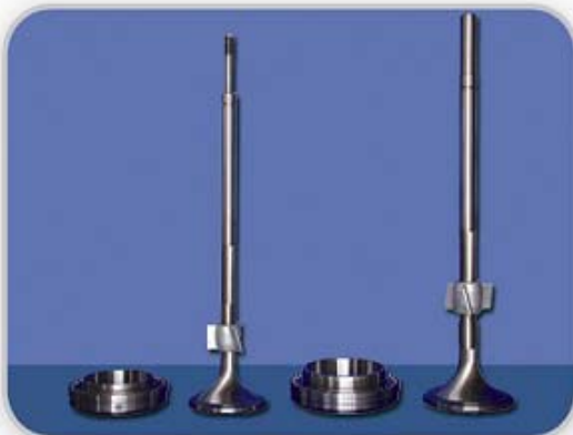
RTA62,RTA58 排气阀, 阀座 RTA62,RTA58 exh. valve spindle,seat