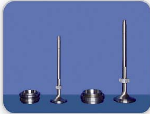
LS/42MC,L/S35MC排气阀, 阀座 L/S42MC,L/S35MC exh. valve spindle,seat