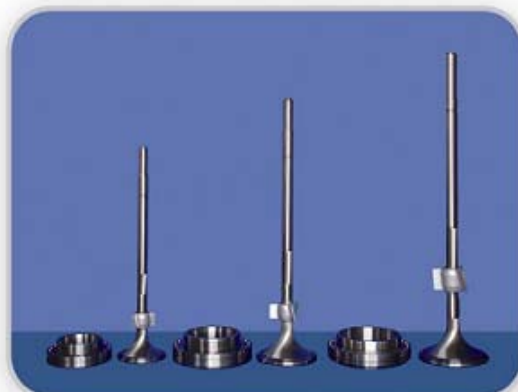
RTA52,RTA48,RTA38 排气阀, 阀座 RTA52,RTA48,RTA38 exh.valve spindle,seat